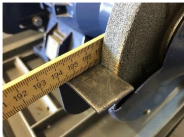
Beispiel für Aufnahme mit Größenvergleich